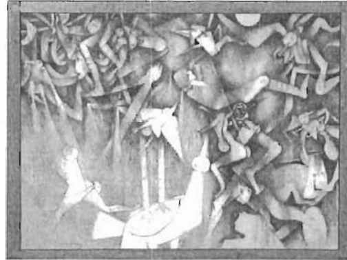
Denominación: "Aves de Totoritas" Autor: Gerardo Chávez López Técnica- Material: Acrílico / Tela Época: 2002 Mediadas: 114 x 146 cms. Sustraída: 14/febrero/2014