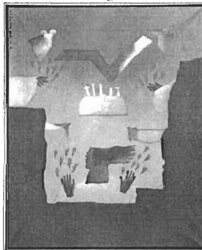
Denominación: "Sueño del fuego" Autor: Venancio Shinki Técnica- Material: Óleo/Tela Época: Indeterminada Mediadas: 162 x 130 cms. Sustraída: 14/febrero/2014