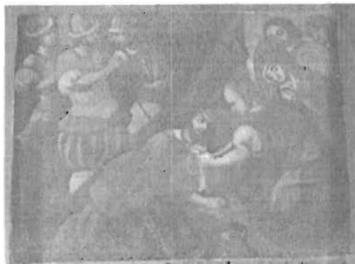
Denominación: "La Verónica enjuga el rostro de Cristo" Autor: P. Anónimo Técnica- Material: Óleo / Tela Época: Siglo XVIII Mediadas: 36.5 x 47 cms.