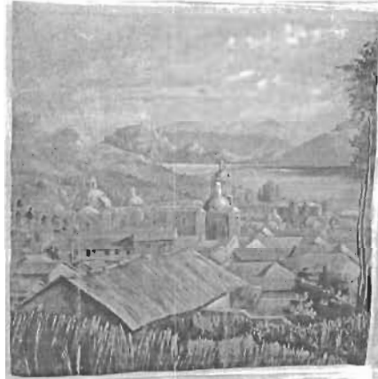
Denominación: "Santuario de Copacabana" Autor: Anónimo Técnica- Material: Óleo / Tela Época: Siglo XX Mediadas: 120 x 118 cms.