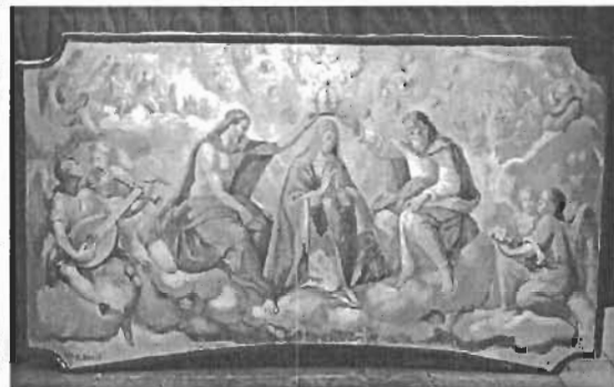
Denominación: "Coronación de la Virgen" Autor: R. Boch Técnica- Material: Óleo / Tela Época: Siglo XX Mediadas: 62 x 106.5 cms.