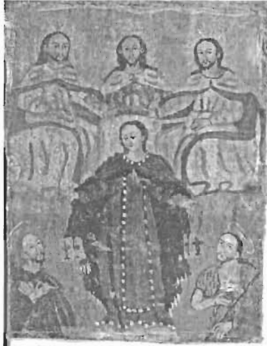
Denominación: "Coronación de la Virgen" Autor: Anónimo Técnica- Material: Óleo / Tela Época: Siglo XX Mediadas: 14 x 10.8 cms.