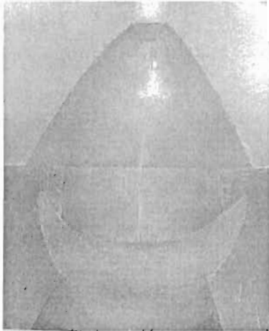
Denominación: "Virgen de Copacabana" Autor: Luis Zilveti Calderón Técnica- Material: Óleo / Tela Época: Siglo XX Mediadas: 75 x 92 cms.