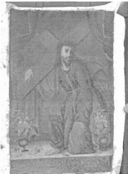
Denominación: "Jesús con la cruz a cuestas" Autor: Anónimo Técnica- Material: Óleo / Tela Época: Siglo XVIII Mediadas: 120 x 79 cms.