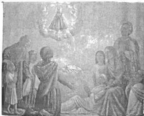
Denominación: "Virgen Copacabana" Autor: P. Eter L. Técnica- Material: Óleo / Tela Fecha: 1944 Mediadas: 155 x 199 cms.