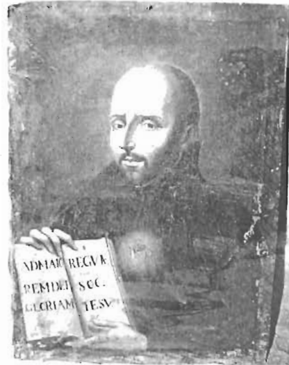
Título: "San Ignacio de Loyola"

Autor: Anónimo Técnica: Óleo/Tela Dim: 59 x 83 cms Época: Virreinal