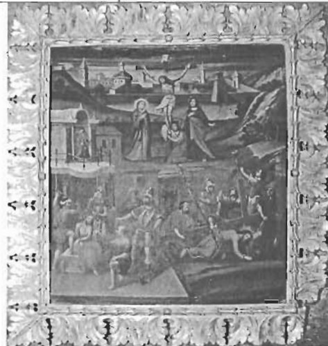
Título: "Pasión de Cristo"

Autor: Anónimo Técnica: Óleo/Tela Dim: 168 x 128 cms Época: Virreinal