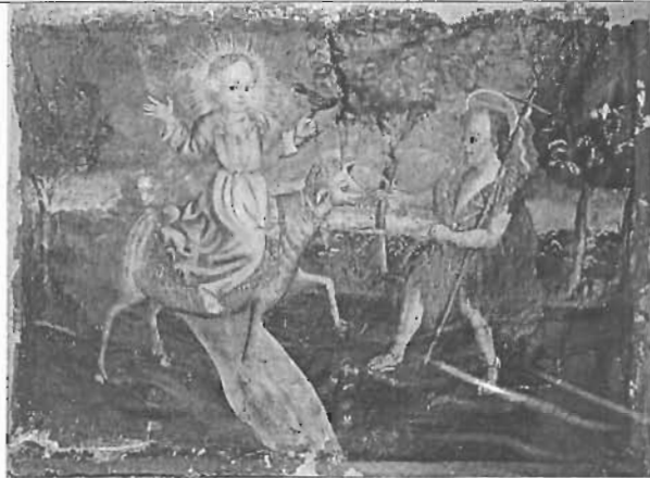
Título: "Niño Jesús y San Juan"

Autor: Anónimo Técnica: Óleo/Tela Dim: 59 x 83 cms Época: Virreinal