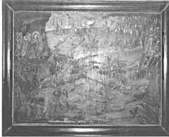
Título: " Crucifixión " Autor: Anónimo Técnica: Óleo/Tela Dim: 98 x 133 cm. Época: Virreinal