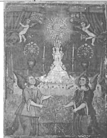
Título: " Adoración a la Eucaristía " Autor: Anónimo Técnica: Óleo/Tela Dim: 117 x 83 cms Época: Virreinal