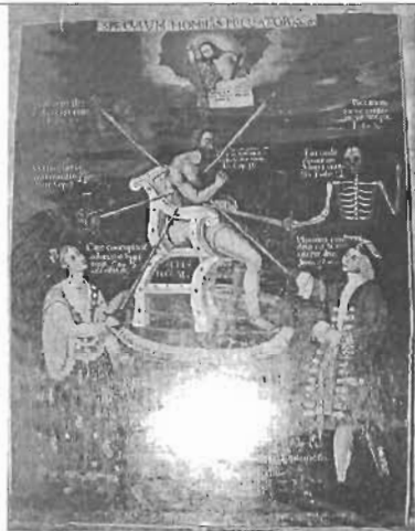
Título: " Hombre pescador " Autor: Anónimo Técnica: Óleo/Tela Dim: 192 x 136 cms Época: Virreinal