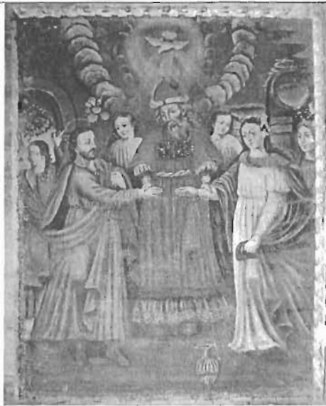
Título: "Desposorios de la Virgen"

Autor: Anónimo Técnica: Óleo/Tela Dim: 84 x 53 cms Época: Virreinal