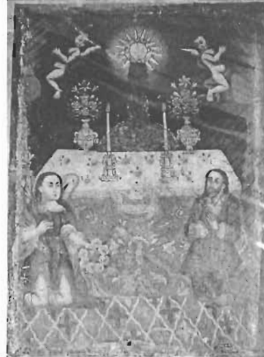
Título: " Adoración de la Custodia " Autor: Anónimo Técnica: Óleo/Tela Dim: 95 x 89 Época: Virreinal